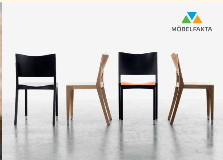
BODONI Abstracta – Voice-kollektionen. Design Jesper Ståhl.